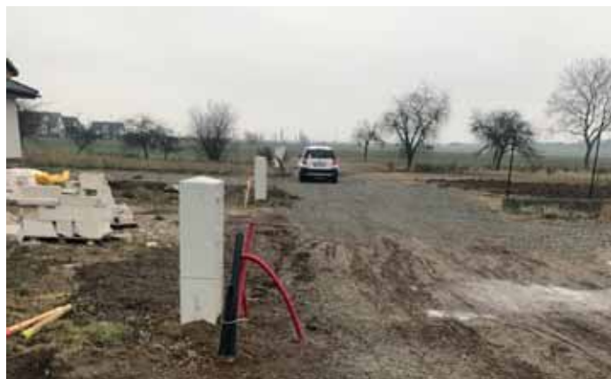
Vybudovanie a kolaudácia rozšíreného NN vedenia na Šalviovej ulici.