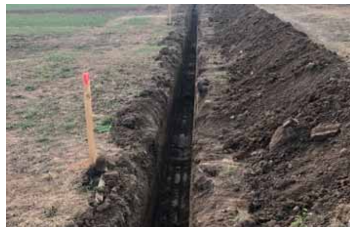
Dobudovanie vodovodu a kanalizácie na Šalviovej ulici.