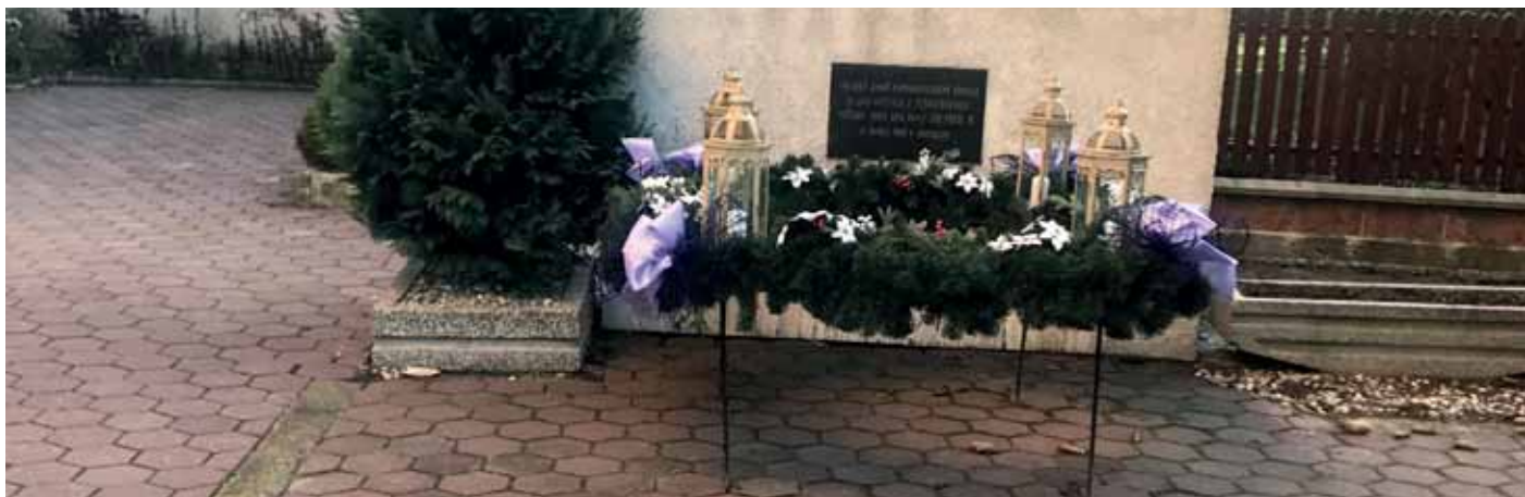
Náš adventný veniec tento rok.