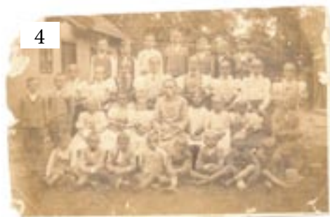
Foto č.1 : Posedenie na výročnej schôdzi JRD 50-té roky Foto č.2: Vínica - zber hrozna 60-té roky Foto č.3: Žatva 1960 Foto č.4: Žiaci školy 1933 Foto č.5: Zábava júl 1943 Foto č.6 5. trieda 1960 Foto č.7 Šebastovská nevesta 15.11.1948 Foto č.8 Archeologické vykopávky - Lapiše 1968